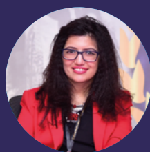
Abia Akram , ativista dos direitos das pessoas com deficiência, fundadora do Fórum Nacional de Mulheres com Deficiência no Paquistão e embaixadora global da campanha Equal World

“Os líderes mundiais devem garantir que a Declaração Política e todos os compromissos nacionais assumidos na Cimeira se concentrem em alcançar aqueles que ficaram mais para trás. Esta é a nossa última oportunidade de colocar os Objectivos de volta nos trilhos. A fim de provocar mudanças sustentáveis, alcançar os ODS e criar um mundo mais igualitário, os decisores globais não podem continuar a ignorar os 16% da população mundial que têm deficiência. Os líderes mundiais devem agir na Cimeira dos ODS, em Setembro, para resgatar os ODS e realmente não deixar ninguém para trás.”